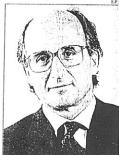
Antoni Brufau, presidente de Gas Natural

ral, sus socios mayoritarios, Repsol y La Caixa, y los minoritarios que quieran. Después, se realizará una ampliación de capital para dar entrada a nuevos socios, como las eléctricas. Pág. 16