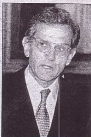
Rafael Arias Salgado, ministro de Fomento.