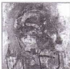
ANTONI CLAVÉ. "Guerrero". Ót. 112 x 112.