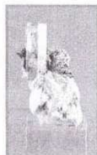
EXTRAORDINARIA COLECCIÓN DE MINERALES

Visite la exposición - Solicite nuestros catálogos - No se desprenda de ninguna pieza sin consultarnos - Anticipos a cuenta