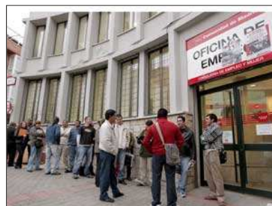
Según el periódico de The Daily Telegraph, el desempleo puede afectar a más de cinco millones de personas.

La adhesión a la UE y el euro están estrechamente vinculados en la mente colectiva de España a la emergencia del país como una potencia europea moderna y dinámica tras el aislamiento embrutecedor de la dictadura franquista. Según el periódico británico, se necesitaría un gran trauma para romper ese vínculo.